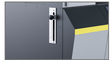
Ajuste de Salida de la Sierra