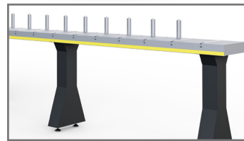
Transportador de Rodillos