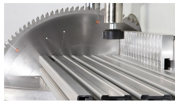
Sierra Ø 500 mm