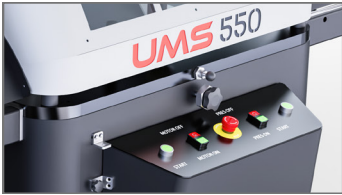
Çift El Kontrol