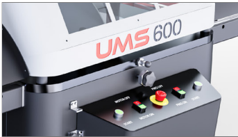
Çift El Kontrol