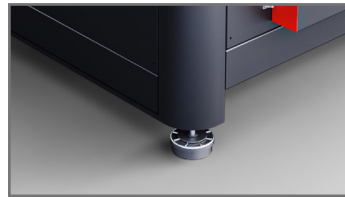
Kauçuk Titreşim Ayakları